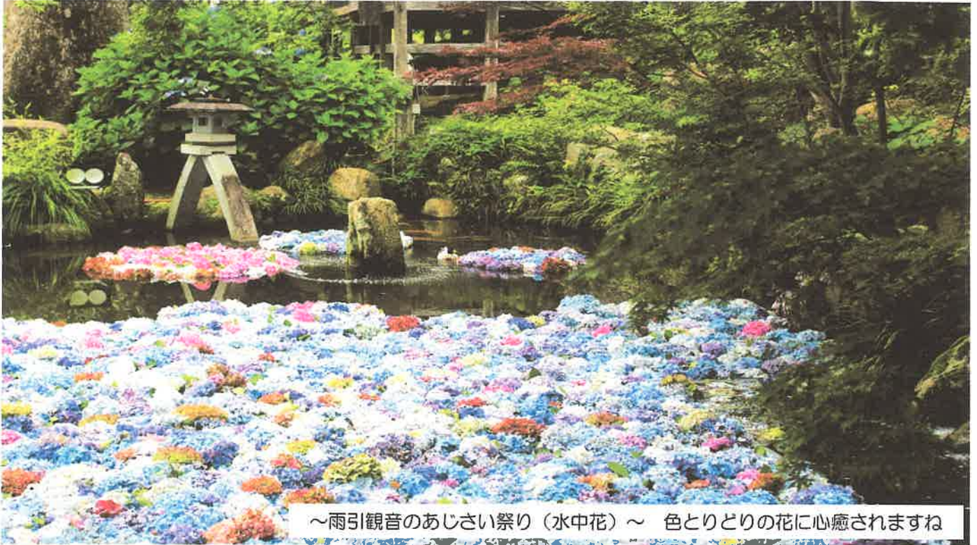
～雨引観音のあじさい祭り（水中花）～ 色とりどりの花に心癒されますね